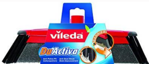
VIL531 4023103095298 VILEDA SCOPA DUACTIVA PZ 6