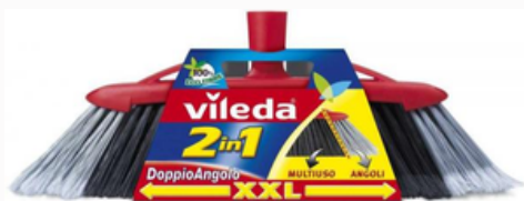
VIL532 4023103095915 VILEDA SCOPA 2INIDOPPIO ANGOLO PZ 6