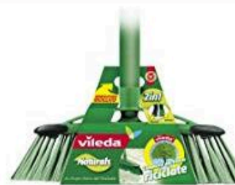
VIL533 4023103136632 VILEDA SCOPA NATURAL 2IN1+MAN PZ 6