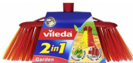
VIL534 4023103095939 VILEDA SCOPA 2IN1 GARDEN PZ 6