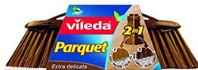
VIL558 8001940012292 VILEDA SCOPA 2IN1 PARQUET PZ 6