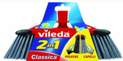
VIL374 4023103095908 VILEDA SCOPA 2IN1 CLASSICA PZ 6