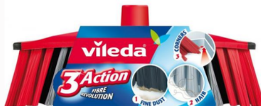
SSS2430 4023103173118 VILEDA SCOPA 3ACTION FIBRE REV PZ 6